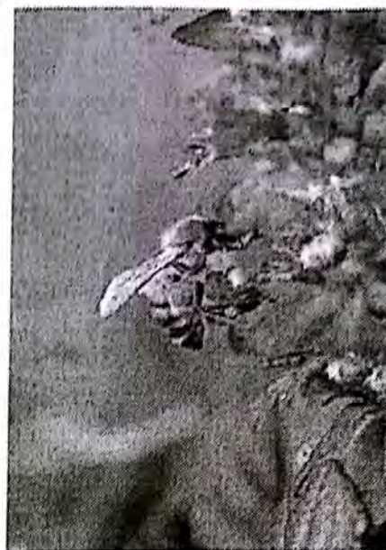
Un'ape mentre si approvvigiona di polline